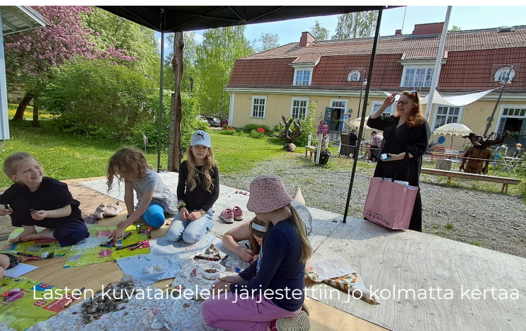
Lasten kuvataideleiri järjestettiin jo kolmatta kertaa

Useat tapahtumat ja työpajat toteutettiin osin yhteistyössä paikallisten kulttuuritoimijoiden kanssa, vahvistaen yhteisöllisyyttä ja Taideniityn roolia Varkauden kulttuurikentässä. Ohjelma toteutettiin pääosin talkoovoimin, ja Varkauden kaupungin avustus mahdollisti pääsymaksuttomat näyttelyt ja konsertit, mikä teki taiteesta saavutettavaa laajalle yleisölle.