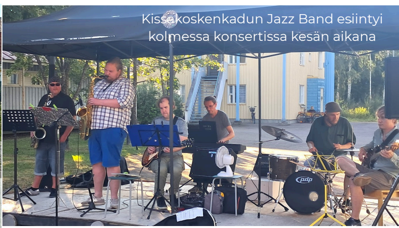
Kissakoskenkadun Jazz Band esiintyi kolmessa konsertissa kesän aikana