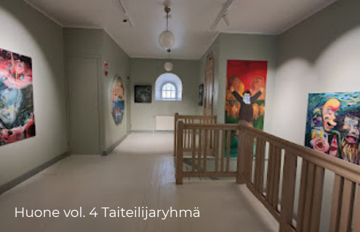
Huone vol. 4 Taiteilijaryhmä

Katso kuvat | Taide- niityn neljäs kesäkausi tuo tarjolle taiteen ja yhteisöllisyyden lisäksi vohveliherkkuja ja uutuusjuomia