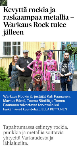
Kevyttä rockia ja raskaampaa metallia – Warkaus Rock tulee jälleen