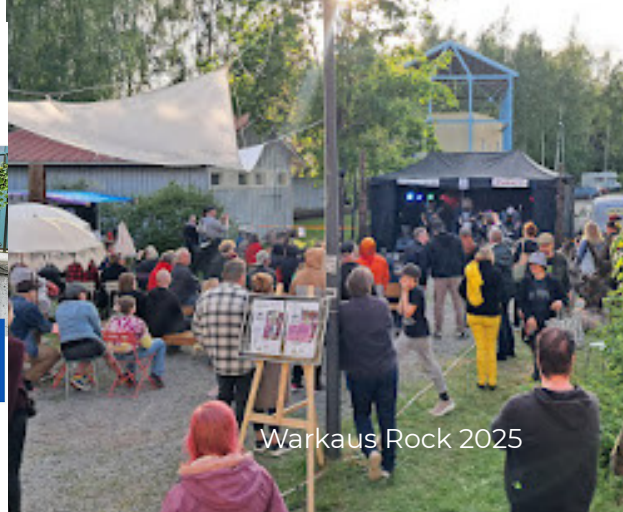
Warkaus Rock 2025

Tapahtumassa esiintyy rockia, punkkia ja metallia soittavia yhtyeitä Varkaudesta ja lähialueilta.