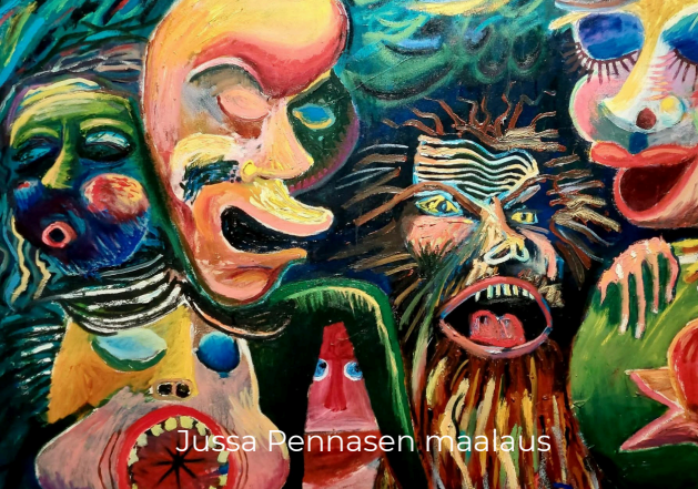
Jussa Pennasen maalaus