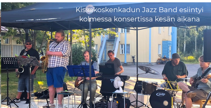
Kissakoskenkadun Jazz Band esiintyi kolmessa konsertissa kesän aikana