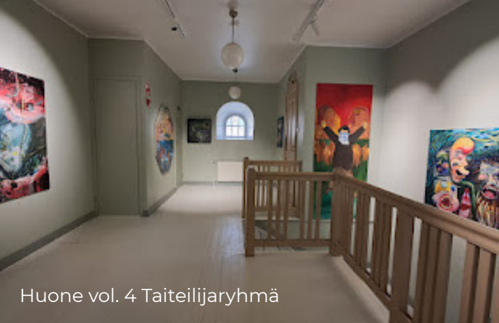
Huone vol. 4 Taiteilijaryhmä

Katso kuvat | Taide- niityn neljäs kesäkausi tuo tarjolle taiteen ja yhteisöllisyyden lisäksi vohveliherkkuja ja uutuusjuomia