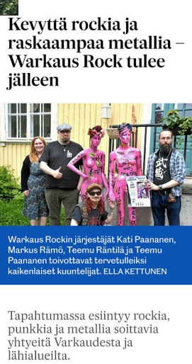
Kevyttä rockia ja raskaampaa metallia – Warkaus Rock tulee jälleen