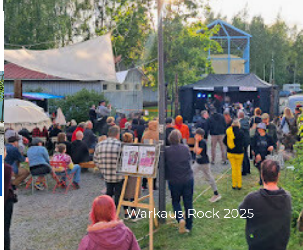
Warkaus Rock 2025