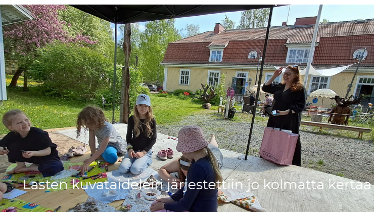
Lasten kuvataideleiri järjestettiin jo kolmatta kertaa

Useat tapahtumat ja työpajat toteutettiin osin yhteistyössä paikallisten kulttuuritoimijoiden kanssa, vahvistaen yhteisöllisyyttä ja Taideniityn roolia Varkauden kulttuurikentässä. Ohjelma toteutettiin pääosin talkoovoimin, ja Varkauden kaupungin avustus mahdollisti pääsymaksuttomat näyttelyt ja konsertit, mikä teki taiteesta saavutettavaa laajalle yleisölle.